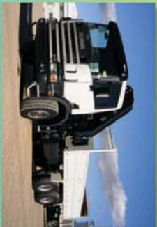
Volquete materiales de construcción con grúa