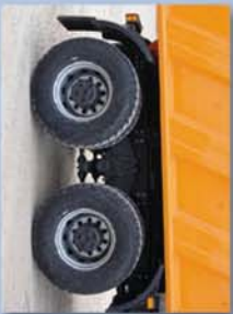
Salvabarros de goma

Volquete de 13,5 m 3 fabricado con aceros antidesgaste de alta resistencia, proporcionando buena estabilidad dimensional y sufriendo menos deformaciones permanentes, permite el uso de menor espesor en el material, lo que conlleva mayor carga útil.