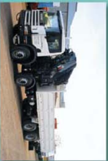
Caja de carga con grúa para trabajos en obra