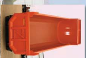
Opcional: Volquete de sección cm 3 90