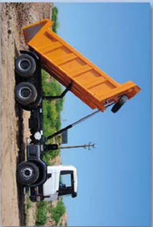
Máximo ángulo de basculación con tija estabilizadora y final de carrera