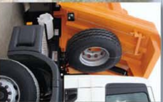
SopORTE de rueda con mecanismo elevador