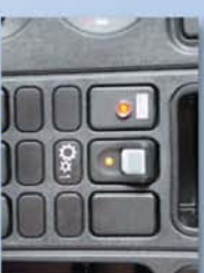
Testigo de volquete levantado en cabina

Piso de 8 mm. de espesor en Hardox 450 (Rm = 135 Kg./mm 2 Dureza: 410 - 490 HB) Laterales de 6 mm. de espesor en Hardox 400 (Rm = 130 Kg./mm 2 , Dureza: 360 - 440 HB)