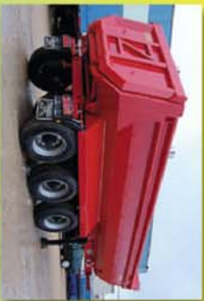
Volquete curvo de 22 m 3 fabricado en Hilarox 450