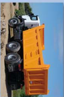
Apertura automática y giro superior