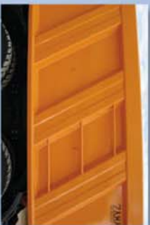
Escalera lateral y ganchos para lona