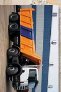
Opcional: Volquete de 18 m 3