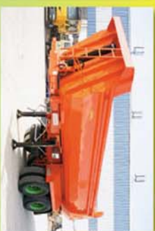
Volquete curvo de 18 m 3 fabricado en Hilarox 450