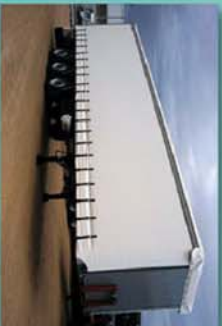
Carrocería de lonas