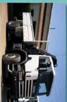
Volquete y grúa para mantenimiento de carreteras

Industrias ZAMARBU S.A. Polígono Industrial, Avda. Principal, parcela 55 13200 MANZANARES (C.Real) Tfno.: 926 647 630 - Fax: 926 647 631 indzamarbu@zamarbu.com www.zamarbu.com