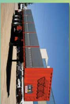
Caja de carga general