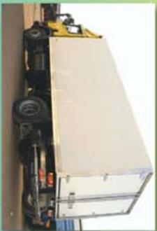
Furgón de carga seca con trampilla trasera