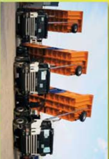
Volquete ZA-F-6/8-IF de 18 m 3 sobre 8x4